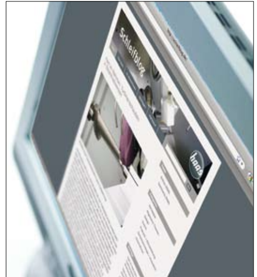
www.schleifblog.de : Ein von uns entwickeltes Weblog für einen feinen Hersteller von Schleifmaschinen

Über Blogbeiträge kann sich ein Interessent ein differenziertes, persönliches Bild über die Meinungsträger eines Unternehmens machen. Im Blog mag es um Mosaikstückchen gehen, aber es sind in der Regel spontane, persönliche Eindrücke, Meinungen, Kommentare zu etwas,